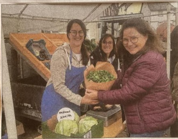
Alle „Akteure“ und Gäste waren sich einig – es war wieder einmal ein gelungener Dorfmarkt. Dankeschön an alle Besucher!

■ Heimat- und Naturfreunde Biebrnheim e. V. Sonniger Dorfmarkt mit Marktfrühstück in Biebrnheim Wie so oft war Petrus den Biebrnheimern gut gesonnen. Bei kaltem, aber gutem Wetter verweilten zahlreiche Einheimische und Gäste im Dorfzentrum „An der Bach“ und genossen das gemütliche Ambiente bei leckerem Essen und Getränken und dem ein oder anderem Einkauf. Neben der deftigen Kartoffelsuppe, die rasch ausverkauft war, und den bewährten „Backesschnitten“ gab es diesmal weitere „Attraktionen“ für Jung und Alt. Kinder bemalten Kürbisse: fröhlich bunt oder auch ganz gruselig. Und woanders konnte Sauerkraut selber gehobelt und eingemacht werden – auch für die Zuschauer eine interessante Erfahrung.